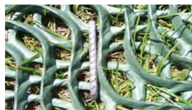
•Vastgezet met U-pennen (verdekt)